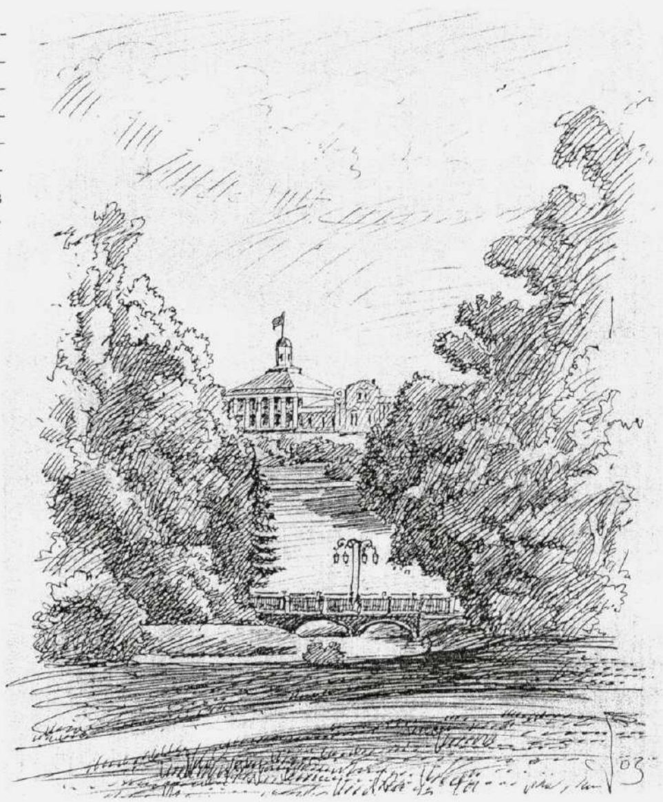
Село Шаблыкино. Усадьба Н.В. Киреевского. XIX в.